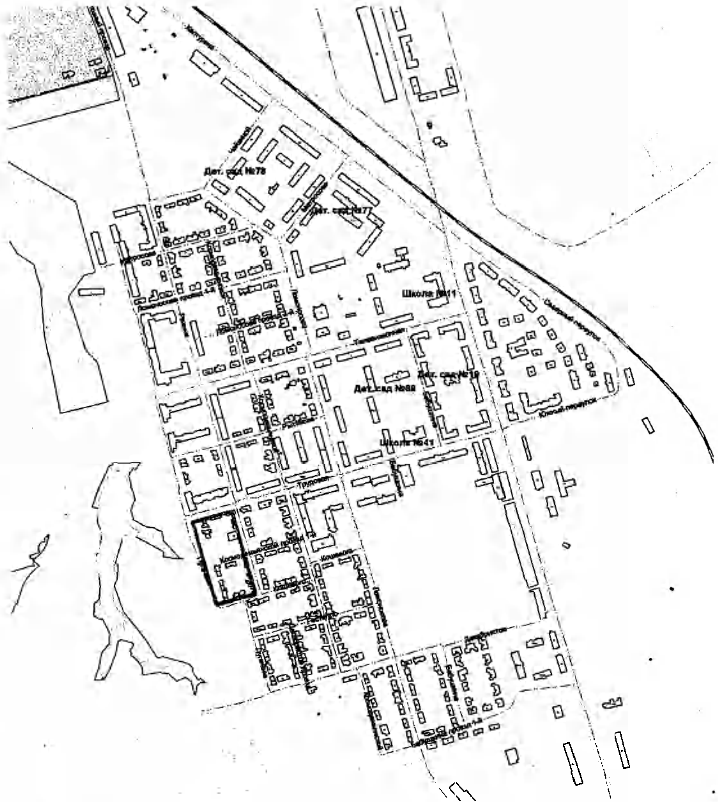
Схема расположения застроенной территории, подлежащей развитию